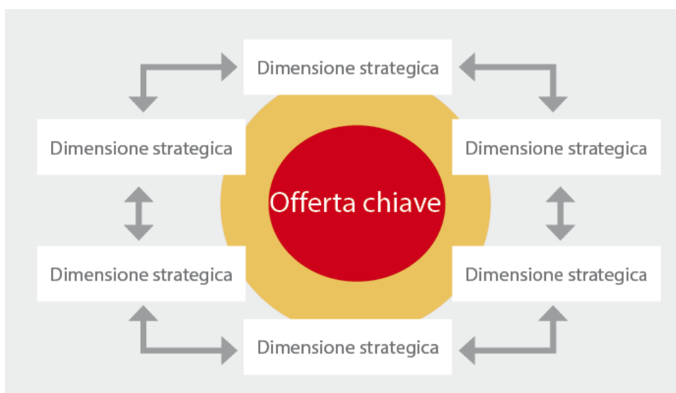
Fig.2: Schema dell'identità di marca

Le dimensioni strategiche sono i fattori distintivi di Cortina e, nel loro complesso, rappresentano il modello di successo futuro. Si integrano a vicenda e riflettono l'offerta chiave nei diversi settori al fine di garantire uno sviluppo comunale duraturo e sostenibile.