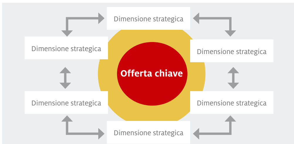
Fig. 2: Rappresentazione schematica del profilo di marchio

Le dimensioni strategiche sono i fattori distintivi di Lana e, nel loro insieme, rappresentano il modello di successo futuro. Si integrano a vicenda e riflettono l'offerta chiave nei diversi settori.